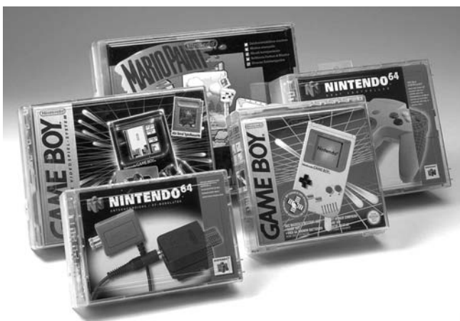
Der Vorteil von SI-Hüllen ist, dass der Kunde das Produkt in die Hände nehmen und die Beschriftung auf der Verpackung gut lesen kann.

Je nach Art der Warenpräsentation muss die SI-Hülle so ausgelegt sein, dass diese selbst stehen, an Eurohaken aufgehängt oder vertikal gestapelt werden kann. Mini- maler Spielraum zwischen dem Produkt und dem Safer garantiert, mehr Produkte zu platzieren und spart dadurch Kosten.